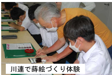
川連で蒔絵づくり体験