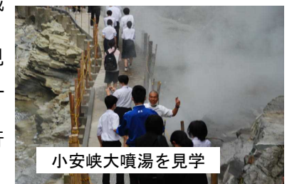
小安峡大噴湯を見学