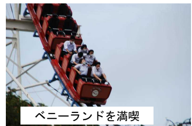
ベニーランドを満喫