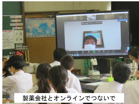
製薬会社とオンラインでつないで