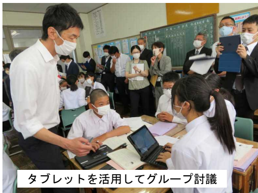
タブレットを活用してグループ討議

世の中のデジタル化は更に進んでいきます。これからもICTを使った教育を推進していきます。