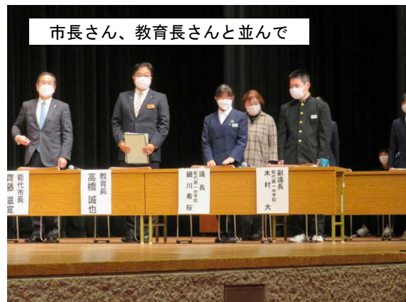
市長さん、教育長さんと並んで

また、「何か質問は」という議長団の問いかけに対し、多数の一中生が挙手し援護しようとする姿勢にも感激しました。全員で仲間を助け盛り上げる。これぞ、覇気の世界です。大成功に終わったふるさと会議。すばらしい一中生でした。